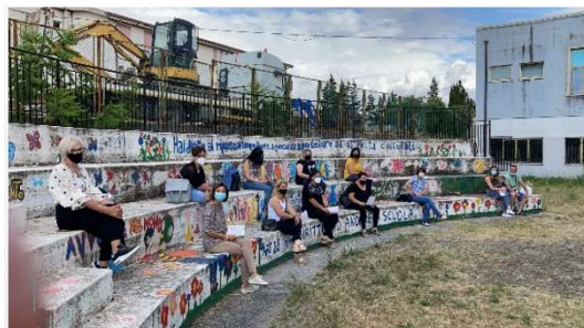
Genitori in formazione su educazione positiva a Scalea

Avere dei progetti in piedi ha aiutato il processo, senz'altro; ma la pandemia ha aiutato tutti a sentirci una parte della risposta e non la risposta. Ci ha aiutato a vincere l'autoreferenzialità, il "far da sé". Ci ha aiutato a valorizzare ogni pezzo della comunità, affinché possa diventare soggetto di azioni positive e concrete.