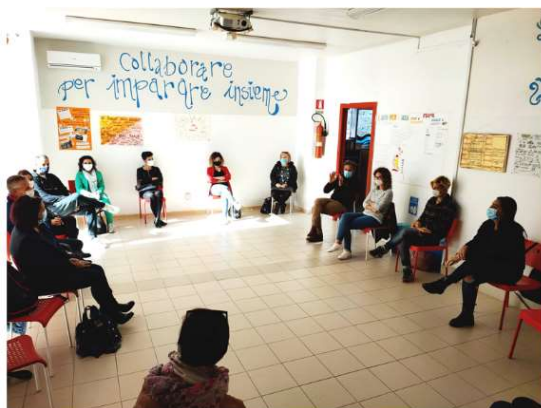
Assessori Istruzione e Pol. Sociali, Pol. Giovanili, Rapporti con le associazioni, Pari opportunità, Famiglia e diritti dei minori in focus group nel Punto Luce di Save the Children.

Un anno in cui i tempi della didattica sono stati scanditi maggiormente da ordinanze di chiusura e di riapertura più che dal classico suono della campanella. Ma, nonostante tutto, è stato un anno in cui si è sentita prepotentemente l'esigenza della Scuola come Istituzione principale in cui bambini e ragazzi scoprono se stessi e diventano cittadini attivi e consapevoli.