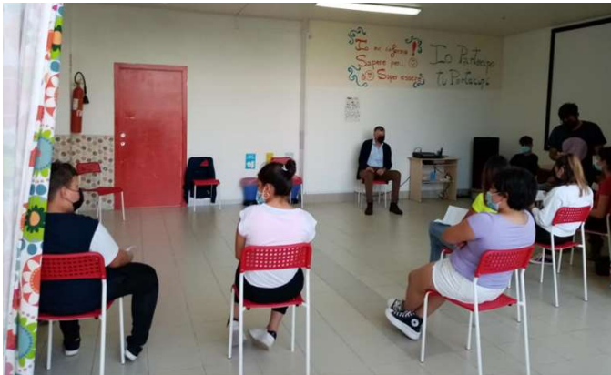
Punto Luce di Save the Children: il DS dell'IC Caloprese intervistato su fare scuola al tempo del covid dal "gruppo peer new media" per la web-radio.

Speriamo oggi di essere al termine della terribile pandemia del Covid 19 che ha ucciso circa 4 milioni di persone nel mondo senza contare gli enormi danni economici che hanno ridotto in povertà una rilevante fascia della popolazione, anche nel ricco occidente, i cui strascichi ci trascineremo ancora per molto